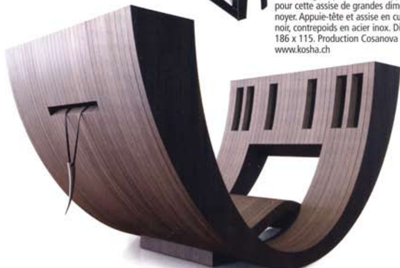
KOSHA. Lignes pures et enveloppantes pour cette assise de grandes dimensions en noyer. Appuie-tête et assise en cuir blanc ou noir, contrepoids en acier inox. Dimensions: 186 x 115. Production Cosanova 2010. www.kosha.ch