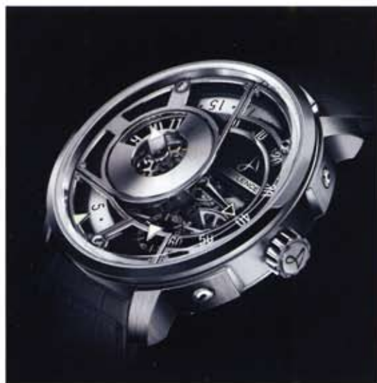
HLQ, montre mécanique haut de gamme inspirée de pièces mécaniques de moteur, affichage et mouvement fusionnent. Hautlence, 2009.