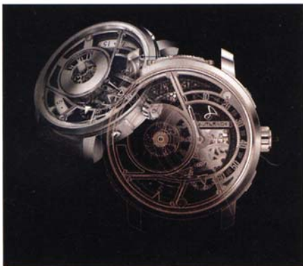
Hautlence – montre mécanique haut de gamme. Design cosanova / Hautlence un design inspiré par l'esthétique brute de pièces mécaniques usinées.